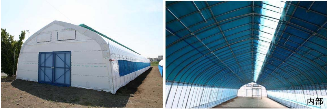
図4 パイプハウス蚕室