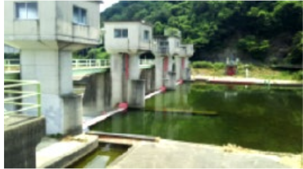
写真1 頭首工

日本の農業が抱える課題の一つとしてダムや用水路など農業水利施設の老朽化があげられます。既存の農業水利施設（基幹的なダム、頭首工（写真1、用語1）、ポンプ場など）約7千カ所の多くは、戦後の食料増産の時代や高度経済成長期に整備されており、その約2割はすでに耐用年数を超過するなど老朽化が進行しています。施設は、一定程度以上に劣化が進むと、大規模な対策工事が必要となるので、劣化の程度をモニター