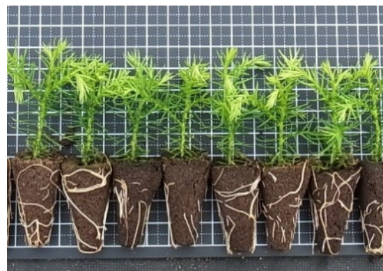
写真1 育成した無花粉スギの苗

この組織培養で育成された苗は100%無花粉スギとなりますので、花をつけさせて花粉の有無を調べる必要はありません。