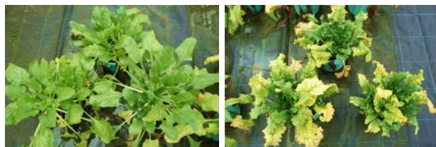
抵抗性系統(写真左)と感受性系統(写真右)の地上部の様子。両系統とも接種後約3ヶ月が経過しているが、地上部の葉の黄化程度に明瞭な差が認められる。

BWYV抵抗性を支配する主なQTLを検出し、特定の両親系統では、地上部黄化の発生程度(黄化指数等)が低い抵抗性系統を効率的に選抜できることを確認した。