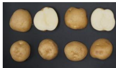
男爵薯(左)ときたすずか(右)

プロジェクト成果を基に、Gp抵抗性加工生食用品種「きたすずか」を育成した。「フリア」は令和2年から本格的な一般栽培が開始され、栽培面積は原原種出荷計画から令和4年度で100-200haと推定される。