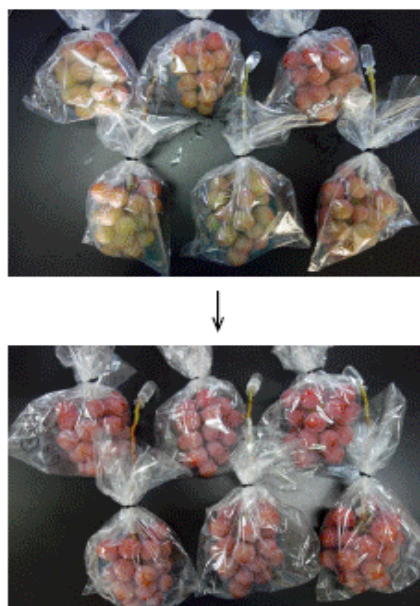
写真3 青色LED光の照射で着色が改善されたブドウ品種「クイーンニーナ」