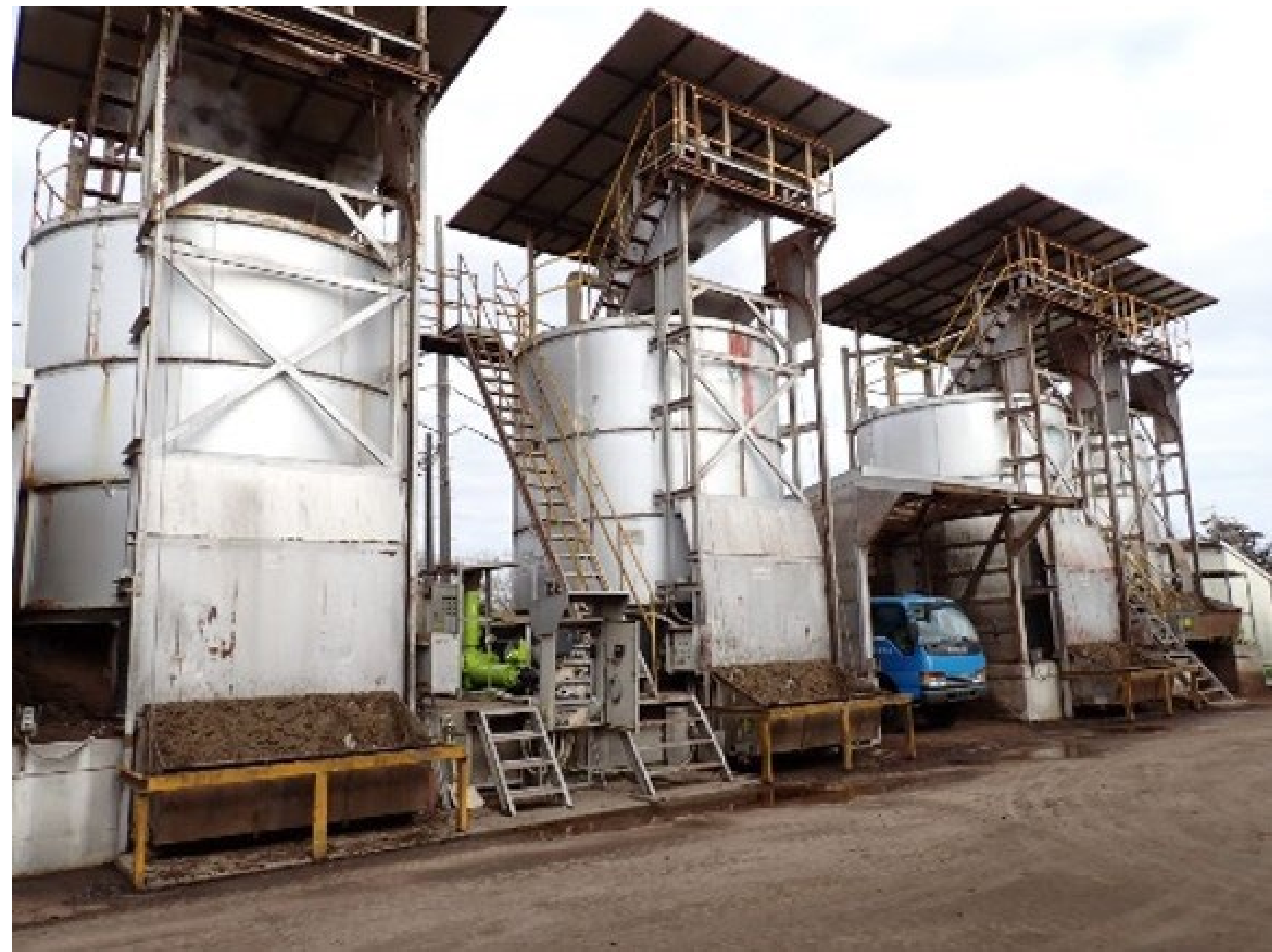
【本課題で採用する方式】 密閉縦型堆肥化装置