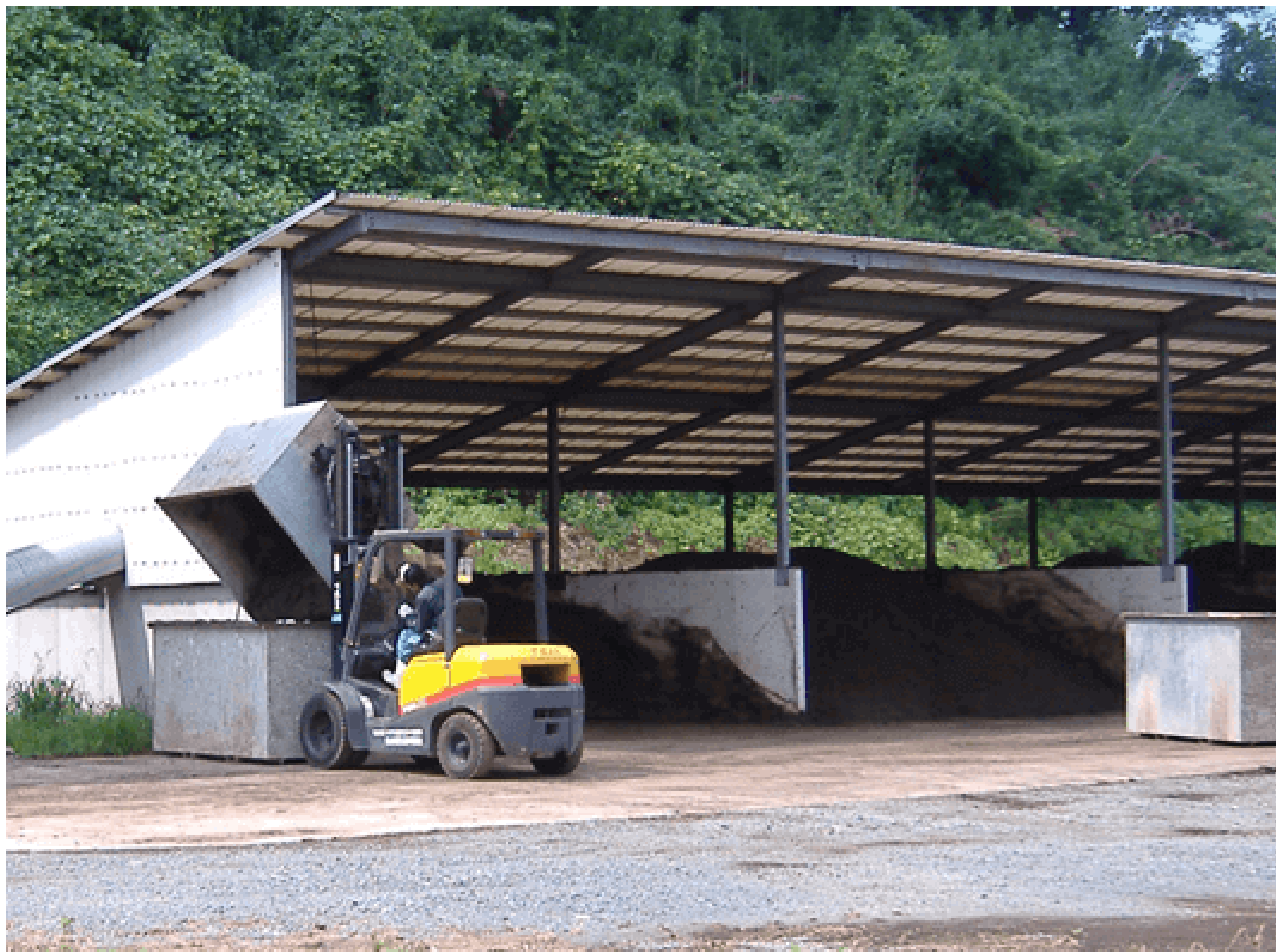
【従来方式】 堆積型堆肥化装置（堆肥舎）