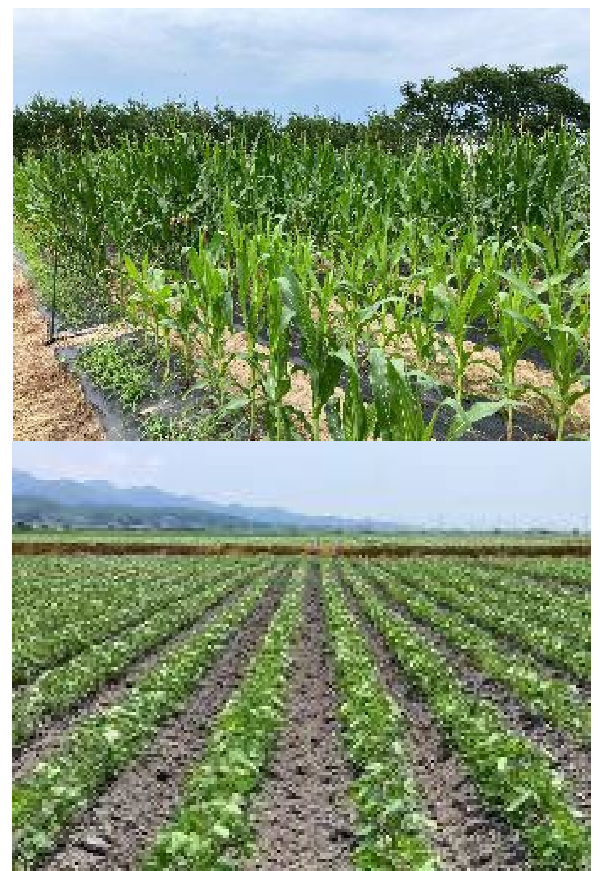
汚泥肥料の特性把握のための 栽培試験