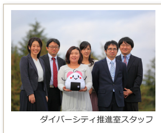
ダイバーシティ推進室スタッフ