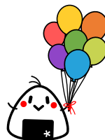
おむすびなろりん ダイバーシティ推進キャラクター