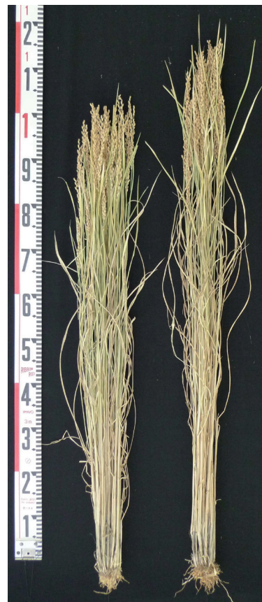
写真1 「笑みの絆」の草姿 (左から、笑みの絆、キノヒカリ)

2002年夏に交配を行い、同年秋に温室栽培により雑種第1代、2003年に温室栽培により雑種第