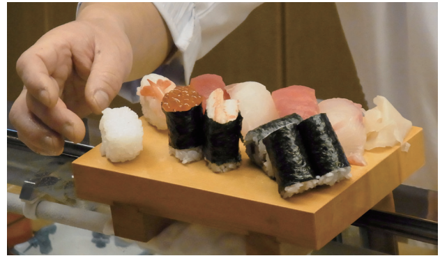
写真 3-2 すし職人による「笑みの絆」の握りずし

テンシプレッサーによる米飯 1 粒の物性測定では、2008 年、2009 年ともに、米飯粒表層は「コシヒカリ」より硬く、粘りは同程度、米飯粒全体では硬さ、粘りともに「コシヒカリ」との大きな差はなかった(表 16)。ラピッドビスコアライザー (RVA) による精米粉の糊化特性は、2008 年、2009 年いずれも「コシヒカリ」より最終粘度および表層老化度がやや大きいことから、「コシヒカリ」よりもデンプ