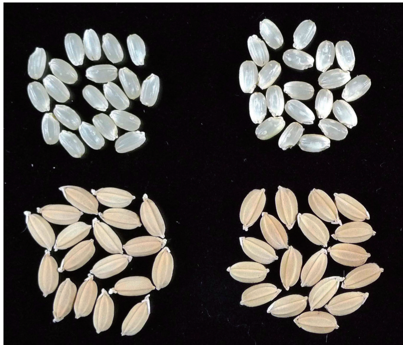
写真2 「笑みの絆」の粳および玄米(左から、笑みの絆、コシヒカリ)

注) 生産力検定圃場の材料を用いた。登熟気温は出穂後20日間の平均値。玄米品質は1(上上)~9(下下)の9段階、腹白、心白、乳白および背基白の多少は0(無)~9(甚)の10段階、玄米の光沢は3(小)~7(大)の5段階、玄米の色沢は3(淡)~7(濃)の5段階で示した。