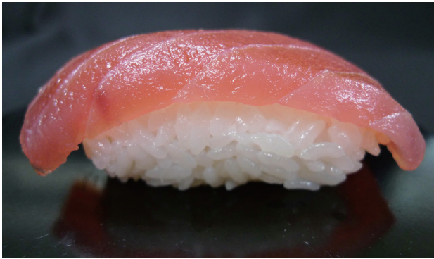
写真 3-1 「笑みの絆」の握りずし（育成地）

「ササニシキ」より弱い。硬さは「コシヒカリ」, 「ササニシキ」, 「コシヒカリ」の古米より硬く、総合では「コシヒカリ」, 「ササニシキ」「コシヒカリ」の古米に優り、「ハツシモ」とほぼ同じである。