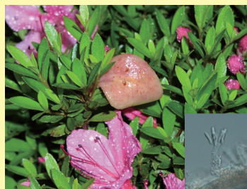
ツツジもち病とその病原菌

元々植物が好きで、大学で植物病原菌に出会いました。卒業後、農水省に入り、お茶、野菜、花の病害防除の研究を続けてきました。その中で、たまたま土の中にいた新種のカビを見つけたり、花の病気の原因を見つけたり、病原菌の越冬場所をみつけたりして、今日に至ります。今はキャベツの病気を防ぐ方法について研究しています。