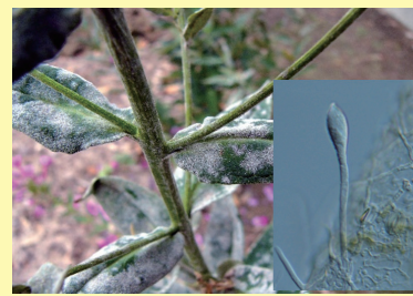
フロックスうどんこ病と胞子