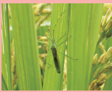
クモヘリカメムシ

これまで、水稻害虫の斑点米カメムシ類やイネツトムシの生態や行動、発生予察に関する研究をしてきました。農業技術コミュニケーターを2年間務めた後、現在は施設イチゴ栽培の天敵利用による害虫管理を担当。趣味はパズルと謎解きと生き物飼育と磯だまりの生物観察と…書いたらきりがありません。博士(理学)。