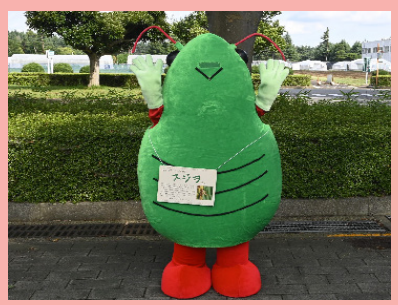
スジロに会えるよ