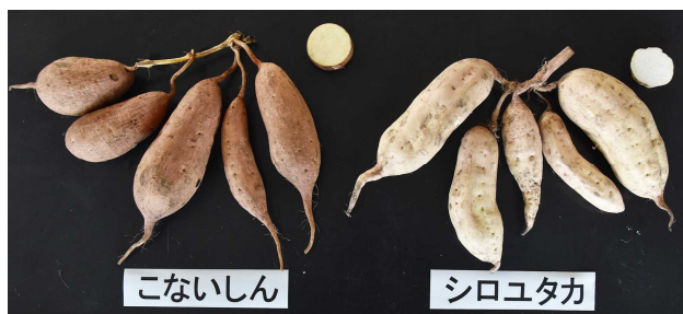
図1 「こないしん」の塊根