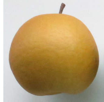
写真1 「甘太」において袋掛けの有無が果実外観に及ぼす影響