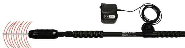
写真1 花蕾採取機

農研機構では、花蕾の採取時間を大幅に短縮できる「手持ち式花蕾採取機」（写真1）を開発しました。この採取機は伸縮可能な棒の先端につけたゴム状のブラシを回転させ、花蕾をはたき落とすものです。群馬県農業技