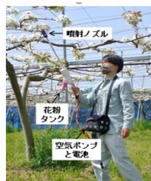
写真2 静電風圧式受粉機の作業の様子

人工受粉に用いる花粉を自前で用意するためには労力を要し、購入するには経費を要します。このため、少ない花粉でも確実に結実する方法が求められています。静岡県農林技術研究所と株式会社ミツワ（新潟県燕市）は、先端に電極を取り付け、花粉に静電気を帯びさせ雌しべへの付着率を上げることで、花粉の使用量を減らしても十分に受粉させることができる「静電風圧式受粉機」（写真2）を共同開発しました。この受粉機を静岡県や埼玉県、福岡県などで試験した結果、ナシで約80%、スモモで約50%、キウイで約60%、花粉の使用量を減らすことができました。現在、同受粉機の実用化を目指しています。