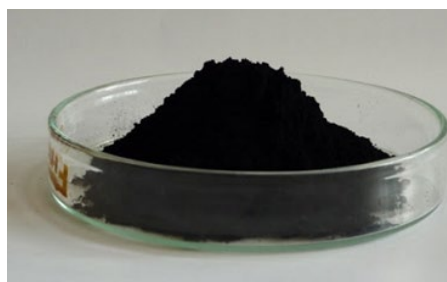
写真2 蓄電量を増やす電極材料のナノ素材

スーパーキャパシタは陽極と陰極の電極が向き合った構造になっており、電極素材の比表面積（用語2）が大きいほど電気を多く蓄えられる性質を持っています。一般に電極素材には活性炭が使われていますが、同社は、より電気を通しやすいCNTを活性炭に配合しました。CNTは炭素で構成された微小な円筒（チューブ）状の物質で、写真2のような黒い粉です。CNTは単位重量当たりの表面積が大きいので、CNTを混ぜると同じ重量でも、より多くの電気を貯めておくことができます。