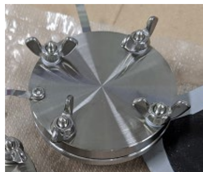
写真 3 ナノ素材を使った電極材料

既にスーパーキャパシタは自動車の回生ブレーキ (減速時にモーターを発電機として活用する仕組み) で発生したエネルギーを回収して充電する装置として使われています。ナノ素材を生かした従来の 3 倍の容量を持つスーパーキャパシタ (写真 3) なら、瞬時に大きなパワーが発揮でき、長寿命の蓄電が可能になることから、将来的には農業機械のエネルギー源として役立つことも期待されます。