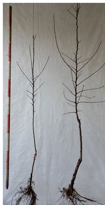
写真1 1年育成(左)と2年育成(右)のフェザー苗

具体的には、わい性台木に「ふじ」などの穂木を接ぎ木して1本の棒状の苗木を育成し、翌春の発芽前に地上50～60cmまで切り戻します。切り戻した枝（幹のもと）から新たに発生した新梢を1本だけ残し、伸長に合わせて、植物成長調整剤のベンジルアミノプリン液剤を散布すると、新梢の腋芽（葉の付け根にある芽）からも新梢が発生します。この新梢をフェザーと呼びます。次の年、つまり接ぎ木から数えて2年目に、十分なフェザーを持った2年育成フェザー苗（写真1、右）を高密度で植え付けることで早期成園化を実現できます。