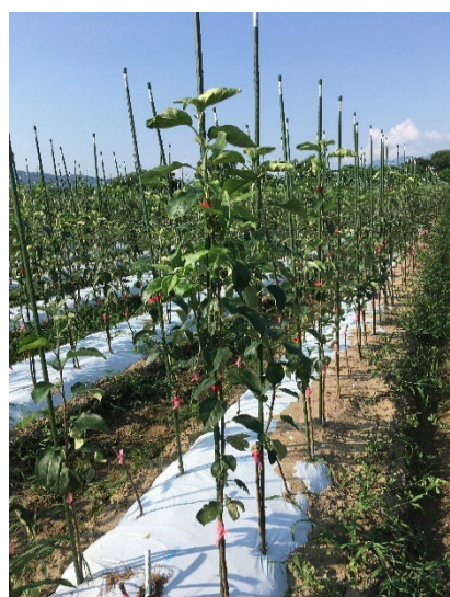
写真2 1年育成フェザー苗の育成場

長野県果樹試験場は将来に向けて、「品質のばらつきが少ない1年育成フェザー苗の安定生産に向けた研究、さらに効率的なわい性台木の生産技術の開発に取り組んでいきたい。」と意欲的に語っています(写真2)。