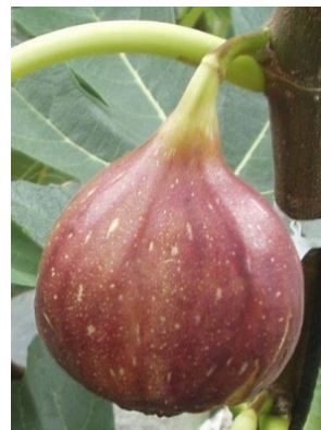
写真3 柘井ドーフィン