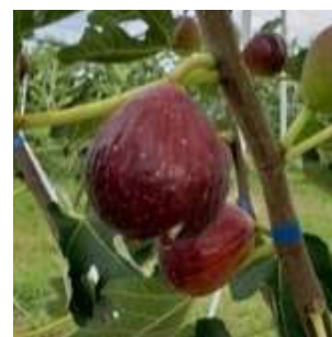
写真5 「とよみつひめ」