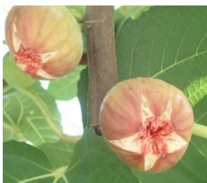
写真4 蓬莱柿