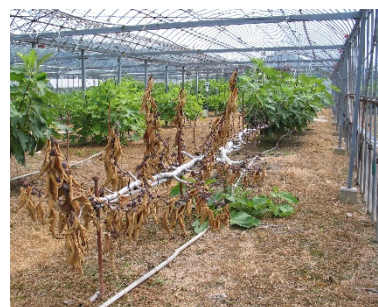
写真1 株枯病で枯死したイチジク

イチジクの主な産地は和歌山、愛知、大阪、兵庫などです。イチジク株枯病は1981年に愛知県で初めて確認され、全国へ広がりました。2021年度は、栽培面積の約2割でこの病気が発生していると推測されています。この株枯病はイチジクで最も深刻な病害のひとつで、株枯病菌（カビの一種）が引き起こします。この菌に感染すると、葉が萎れて変色し、やがて樹全体が枯死します（写真1）。土壌中に株枯病菌が残るため、病気が発生した土壌では新しい苗木を植えても、また感染し、数年のうちには枯れてしまいます。殺菌剤を土壌に注入する方法もありますが、安定した防除効果を得るために年間6回の注入を毎年行う必要があり、費用と労力の面から中々普及が進まないのが現状です。