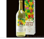
ジュース・ワイン