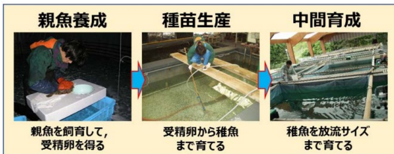
図 1：人工種苗の生産工程

稚魚（人工種苗）の生産工程（図 1）は、親魚を飼育して受精卵を得る「親魚養成」、受精卵から稚魚まで育てる「種苗生産」、稚魚を放流や養殖開始に適したサイズまで育てる「中間育成」の 3 工程に分けられます。飼育の難しいホシガレイでは、いずれの工程においても死亡や成長不良などの問題が多く、大量に健全な稚魚を飼育することができませんでした。そのため稚魚（8cm）は 1 尾 180 円と値段が非常に高く、栽培漁業や養殖の事業化には、このコスト削減が課題でした。