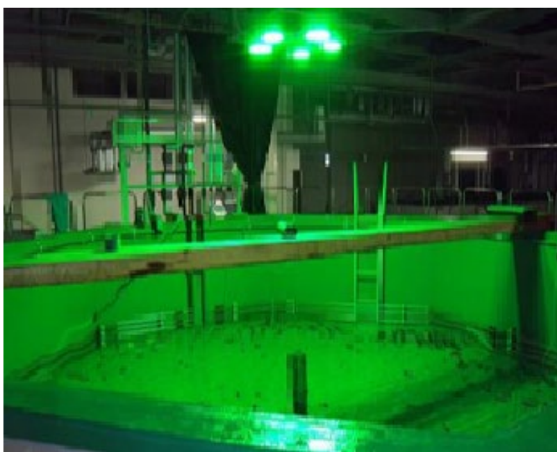
写真2：緑色LED灯を付けた屋内飼育場

LED灯による緑色光を照射した養殖実証試験では、自然光では2年かかっていた出荷サイズ（重量700g、体長40cmほど）になるまでの飼育期間を、1年に短縮することができました。この養殖試験では、研究グループがカレイ類の光の感じ方に合わせて開発した緑色LED灯を使用しています（写真2）。