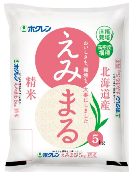
写真2：えみまるのパッケージ