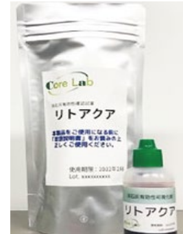
写真1：リトアクア

消石灰に2～3滴落とし、白から赤紫色に変化すると効果なし、白から青色に変化すると効果ありと、瞬時に判断できます（写真2）。本成果は、農林水産省「2020 農業技術 10 大ニュース」に選定され、令和4年度北海道新技术・新製品開発賞ものづくり部門奨励賞も受賞しており、家畜伝染病対策への貢献が期待されます。