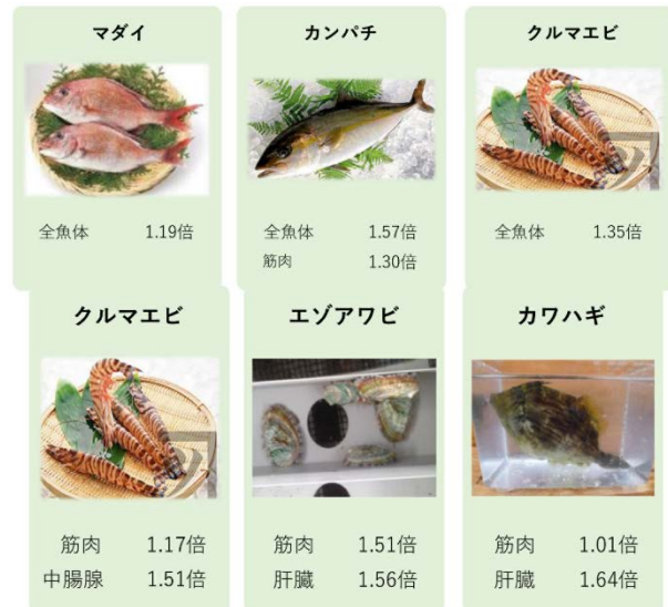
図3 DHA強化魚作出技術開発