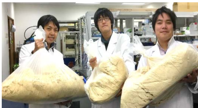
写真1 培養されたオーランチオキトリウム