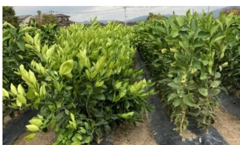
図2 ウンシュウミカン「宮川早生」の1年生大苗（左）と慣行1年生苗