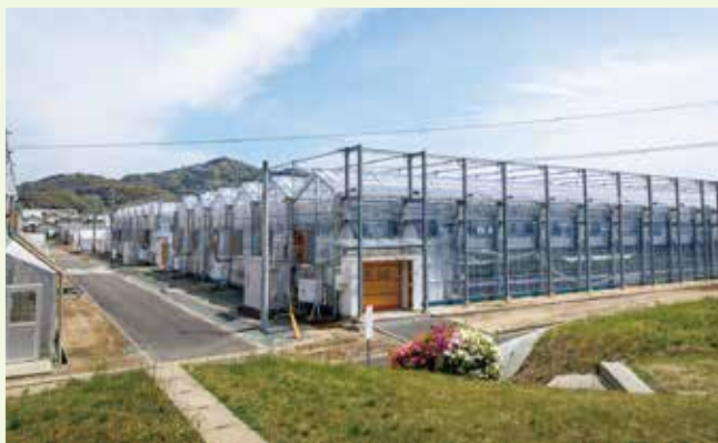
太陽光利用型植物工場

当センターの研究員等による指導のもと、技術開発、品種改良に関する研究課題の遂行に関与しながら、野菜栽培に関する知識・技術を習得します。