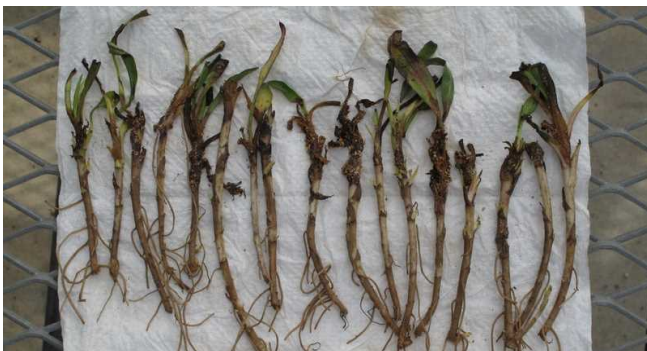
茎葉が褐変している(株分け)