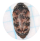
アカマダラ カツオブシムシ