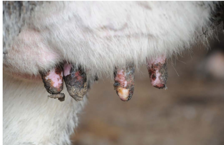
乳頭のびらん、痂皮(ホルスタイン種)