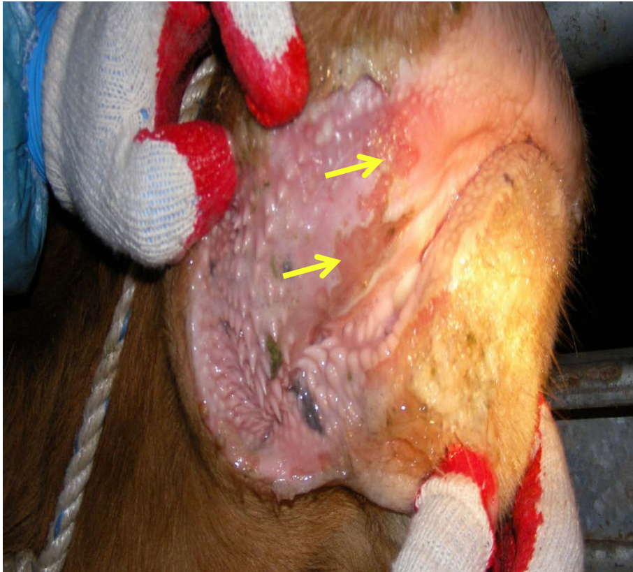
口腔内のびらん(韓牛)