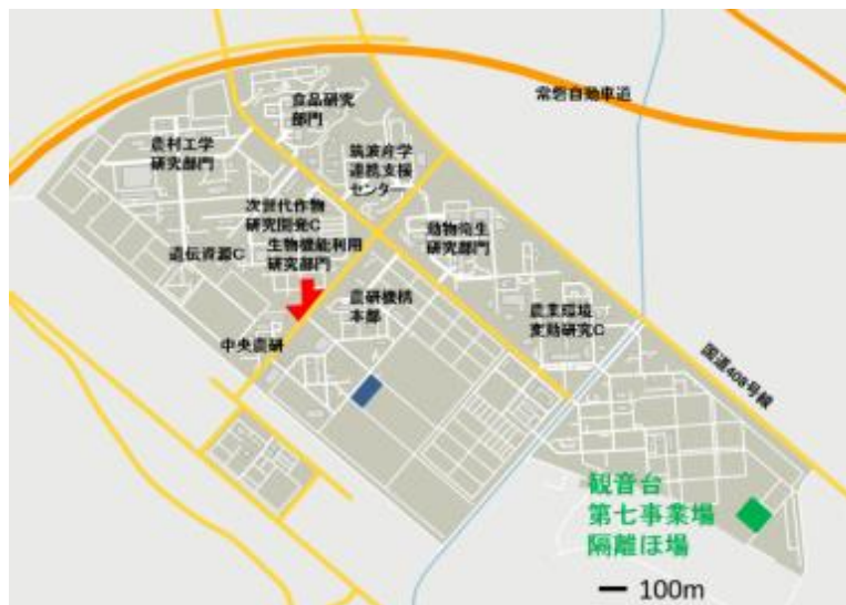
図3 農研機構つくば観音台事業場配置図