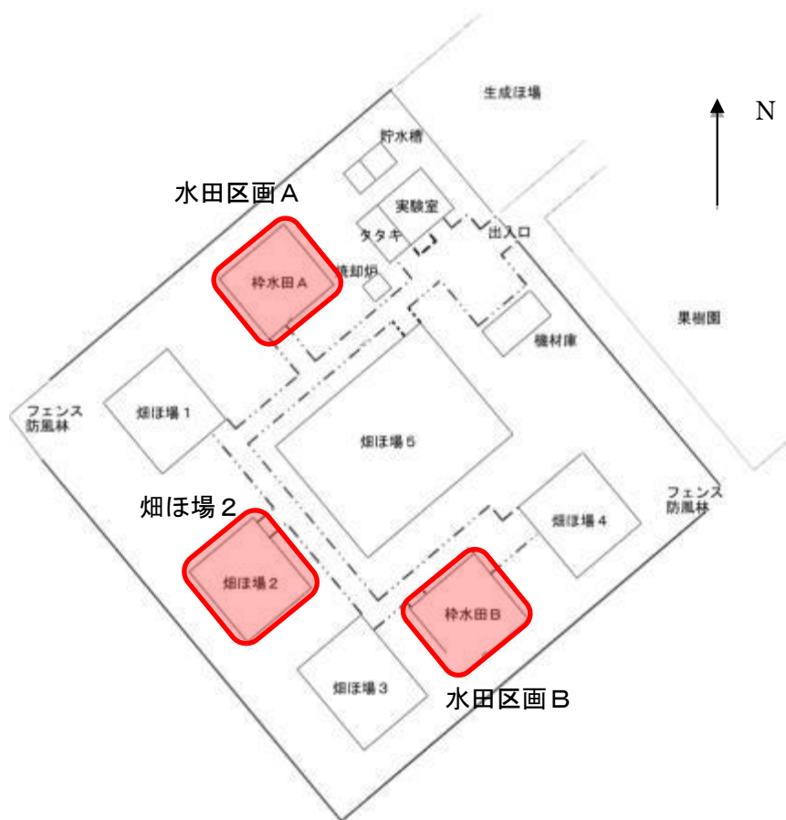
図5 隔離ほ場内配置図