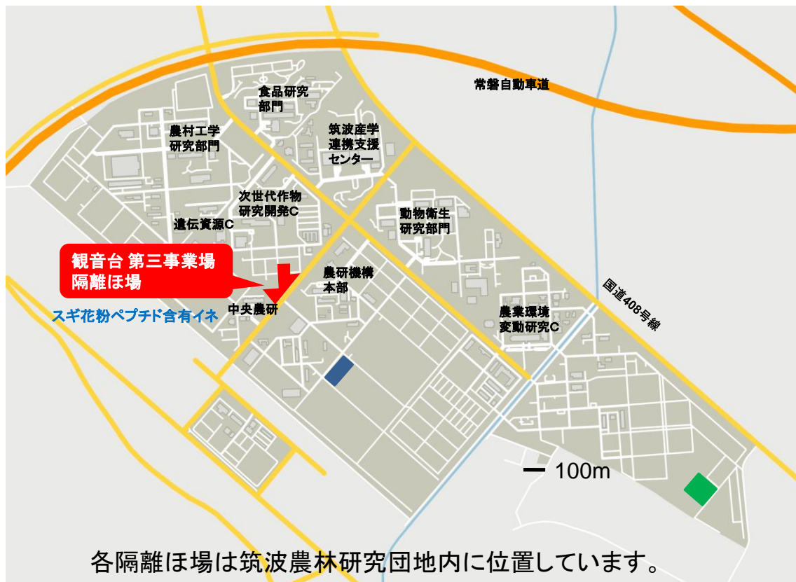
図 1 つくば市観音台地区周辺図