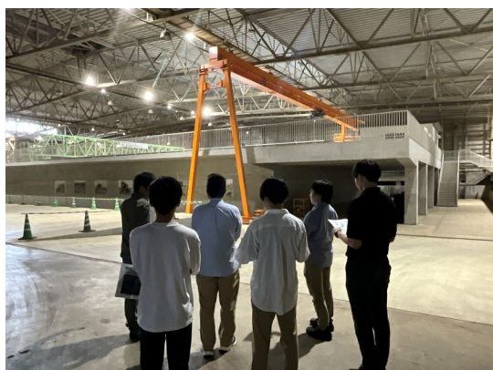
造波装置（中矢グループ長）