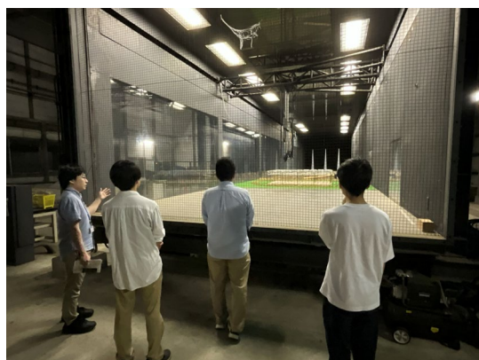
大型風洞設備（於保研究員）