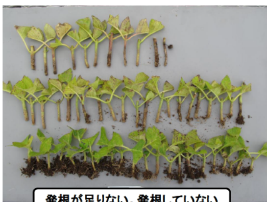
発根が足りない。発根していない