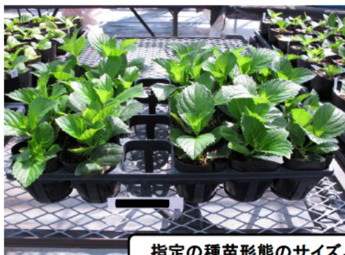
指定の種苗形態のサイズより大きい(セルトレーではない)