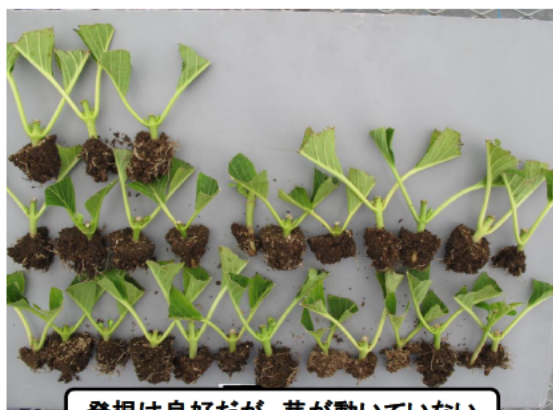
発根は良好だが、芽が動いていない