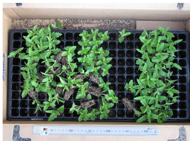
荷崩れして別の品種と混じっている