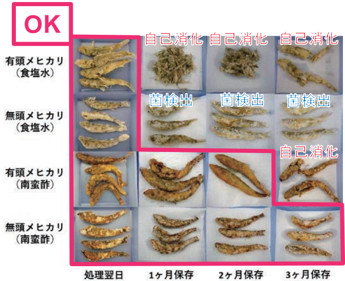
図4 高圧処理したメヒカリの唐揚げ