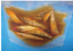
図2 メヒカリの高圧加工品

冷蔵約2日で傷み始めるメヒカリを高圧加工により唐揚げ用素材として試作し、長期冷蔵保存の可能性を検討した。頭部及び内臓を除去したメヒカリを十分に洗浄後、南蛮酢と共に脱気包装し、高圧処理 (600 MPa, 10 °C, 5 min) したところ、5 °C で3ヶ月間の保存が可能であった。メヒカリの高圧加工においては、自己消化の抑制に加え、微生物制御が重要である。