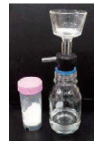
結晶化し、標品を単離