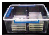
浅型容器での酵素反応 (酸素の十分な供給)