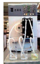
電気透析による精製