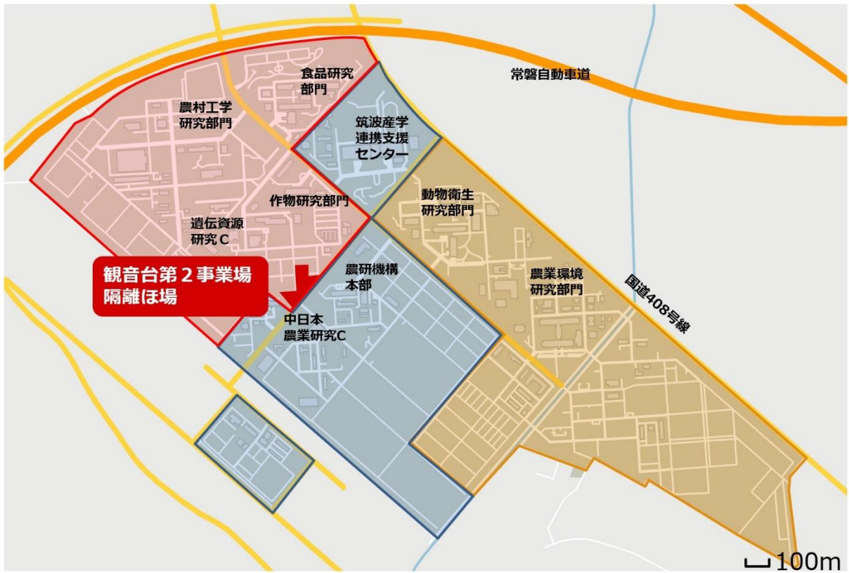
図 1 つくば市観音台地区周辺の地図と各隔離ほ場の配置