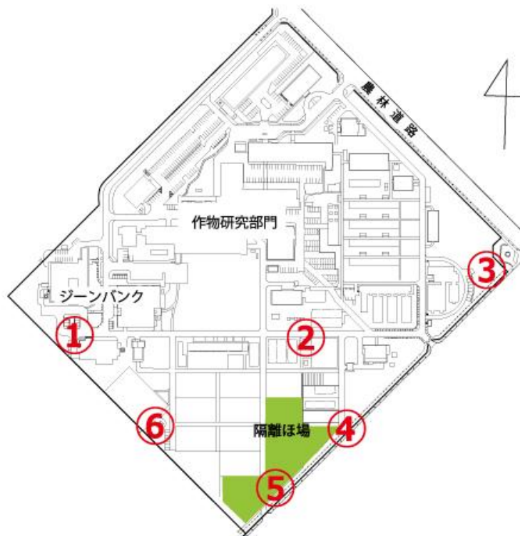
図 3 観音台第 2 事業場隔離ほ場（緑色）周辺のモニタリング用指標作物の配置場所（赤数字）