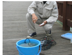
ヒモつきのバケツを用いて離れた地点の水質を計測