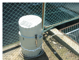
オートサンプラー