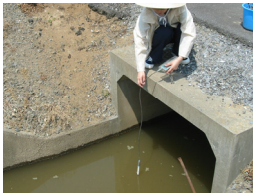
場を乱さないように静置状態で計測