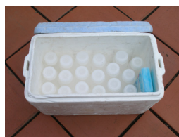
ボックス内で容器が動かないように固定