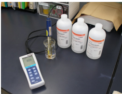
計測器の校正は定期的を実施