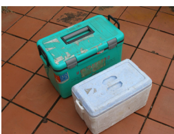
クーラーボックス