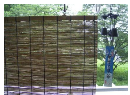
写真3：節電の夏はこの二つの和のアイテムで凌ぎました

大学入学までの18年間を大阪・淀川の畔で過ごし、山陰・鳥取で4年間学び(遊び?)、大学院の時から筑波山の麓に来ました。関西にいた頃は、それほど意識することはなかった大阪愛が関東に来て目覚めてしまった感じで、関西出身の方に会うと嬉しくなってしまいます。プライベートでは、日本酒、日本茶、手ぬぐい、風呂敷、朝顔など、和の香りがするものをこよなく愛します。日本酒も好きなのですが、最近はなかなか飲める機会がないので、いつでも飲める日本茶にはまっています。研究室を訪ねて頂ければ、お薦めの日本茶をお煎れしますので、ご遠慮なくお訪ね下さい。