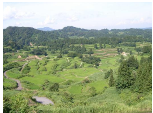
写真1：十日町市峠地区の棚田

人と土地との関係をデザインするランドスケープが専門。現在は、地理情報システム (GIS) や航空写真・衛星画像解析などのリモートセンシング等を用いて、耕作放棄地などの問題が深刻化する農地等の地域資源の保全・管理に関わる研究・開発に取り組んでいます。