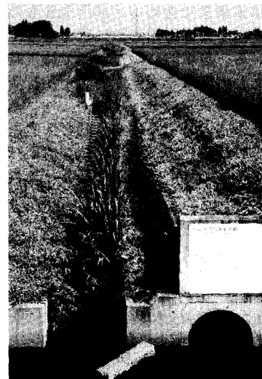
写真2 2段式水路;中央部の土水路が千鳥X型魚道によって支線排水路と連結している。右下に暗渠の出口が見える。(栃木県西鬼怒地区)

における効果的・経済的設計に苦慮している。河川改修などですでに普及している技術であっても、水田生態系においていかに適用すべきか、ひとつひとつ検証していくことが必要だ。