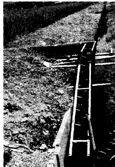
写真1 千鳥X型を用いた水田直結型魚道の例 (栃木県上三川町)

水田生態系において魚巣ブロックの効果が長期間モニタリングされた事例は少なく、現場技術者は農業水路系