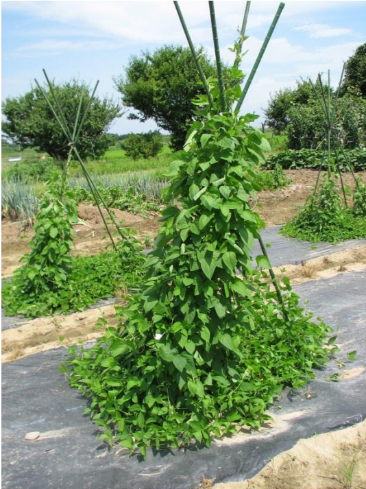
野生大豆の植物体

ツルマメとも呼ばれ、中国、朝鮮半島、日本、ロシア東部などに自生しています。栽培大豆の学名が Glycine max であるのに対し、 Glycine soja と、別種として扱われていますが、交配は可能です。栽培大豆は、3000年-5000年ほど前に、中国で野生大豆が栽培化され誕生したと考えられています。