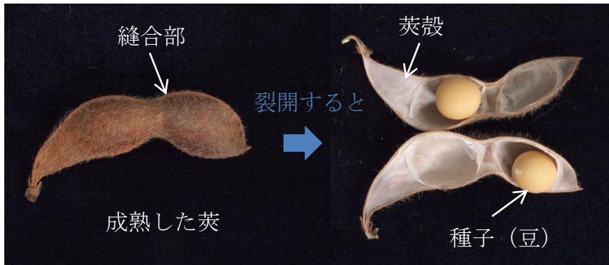
図 1. 大豆の莢の構造