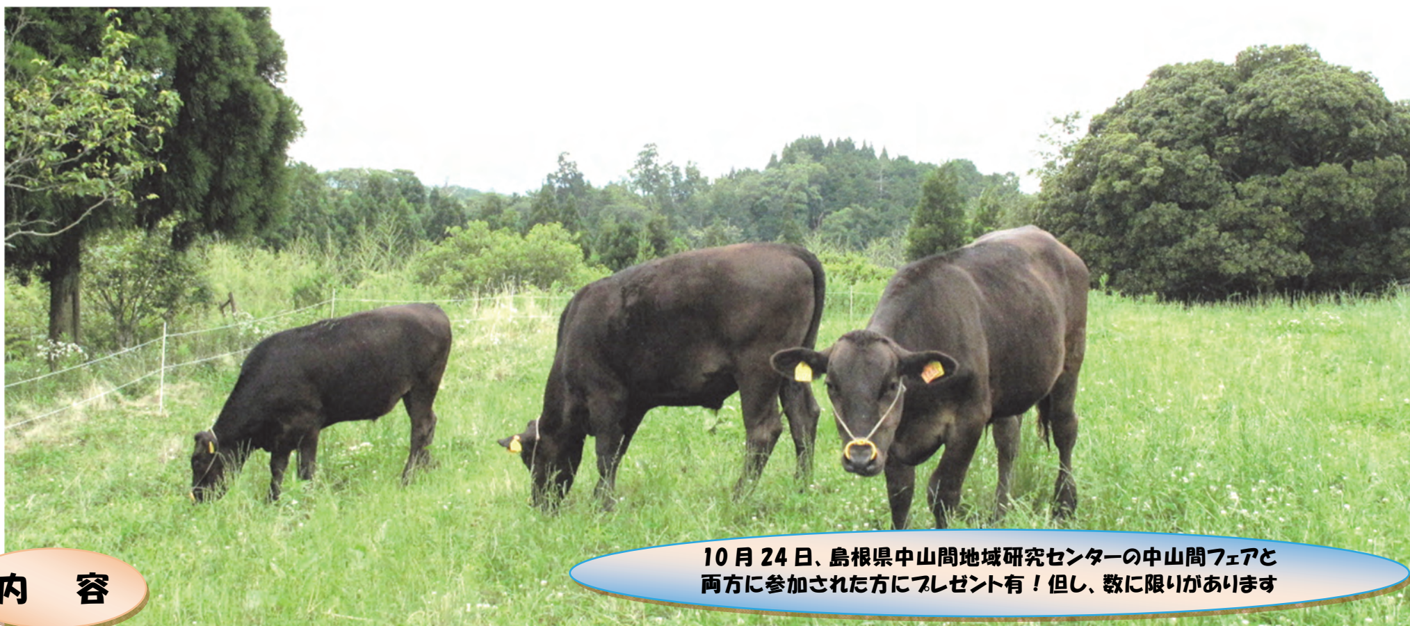
10月24日、島根県中山間地域研究センターの中山間フェアと両方に参加された方にプレゼント有！但し、数に限りがあります