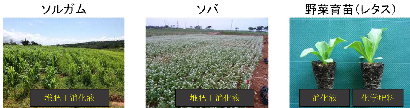
写真1 メタン発酵消化液の新規導入作物（ソルガム、ソバ）や野菜育苗への利用