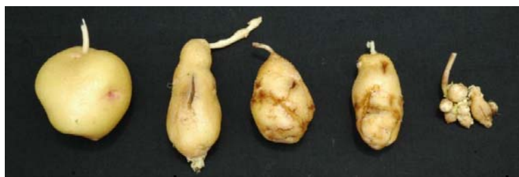
健全なジャガイモ

【ロシア側研究機関】 バビロフ植物遺伝資源研究所 全ロシア植物保護研究所 (植物保護研)