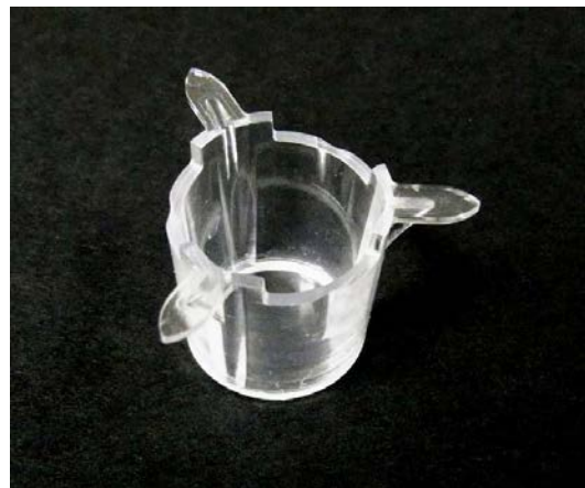
図2 ビトリゲル®膜チャンバー （筒状の枠の底面にビトリゲル®膜がはられている）