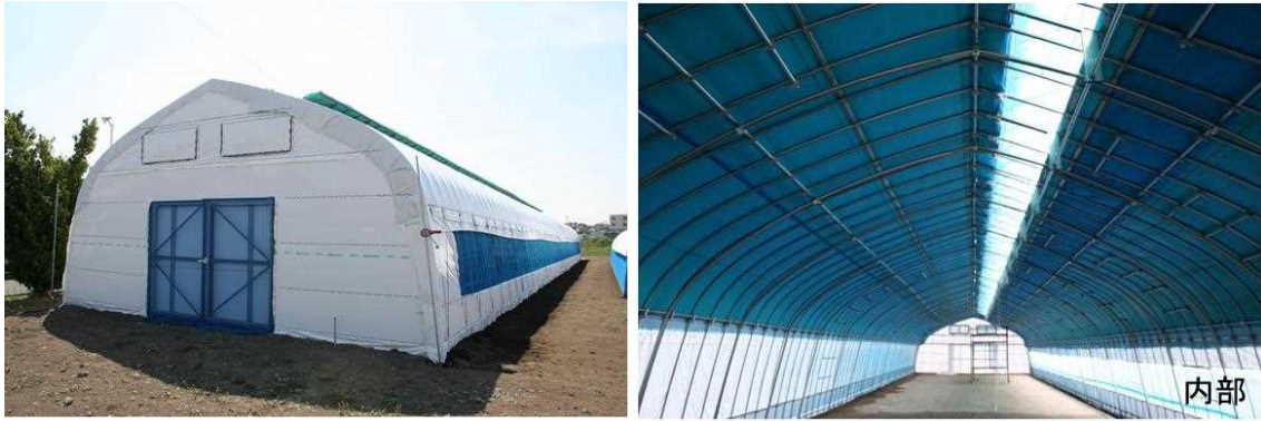
図4 パイプハウス蚕室