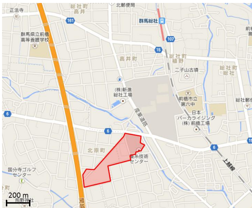
図2 蚕糸技術センター周辺の地形図 赤く囲んだところが蚕糸技術センターの敷地