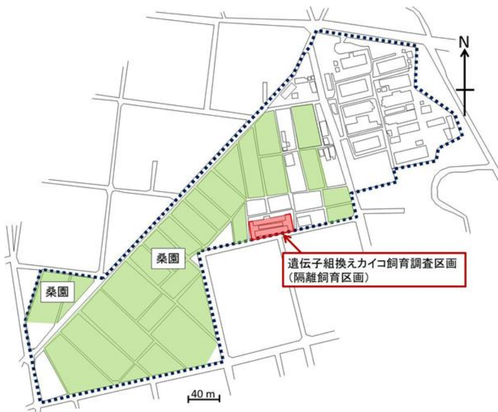
図3 群馬県蚕糸技術センター内配置図 赤く囲んだところが隔離飼育区画