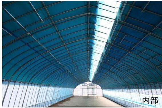
図4 パイプハウス蚕室