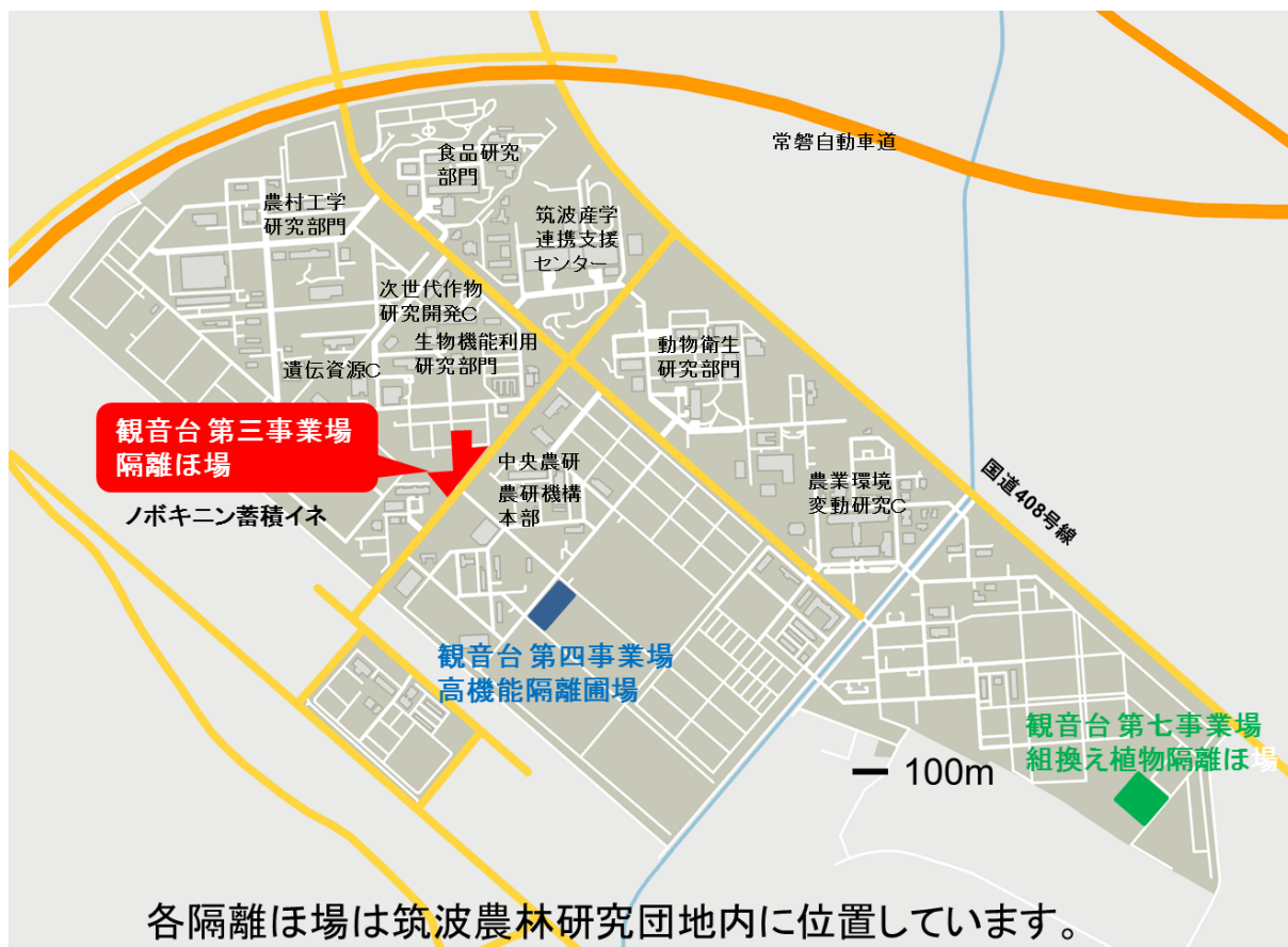
図 1 つくば市観音台地区周辺の地形図