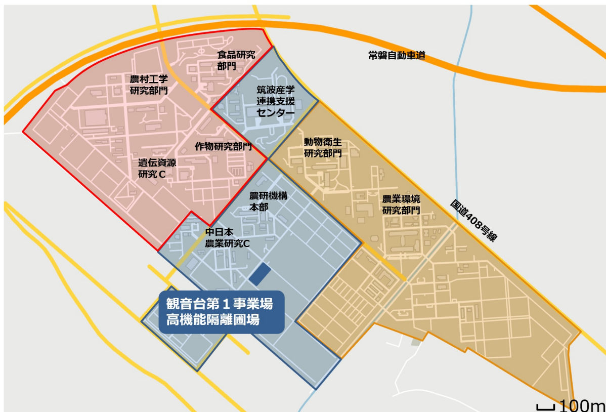
図 1 つくば市観音台地区周辺の地図と観音台第 1 事業場高機能隔離圃場の配置