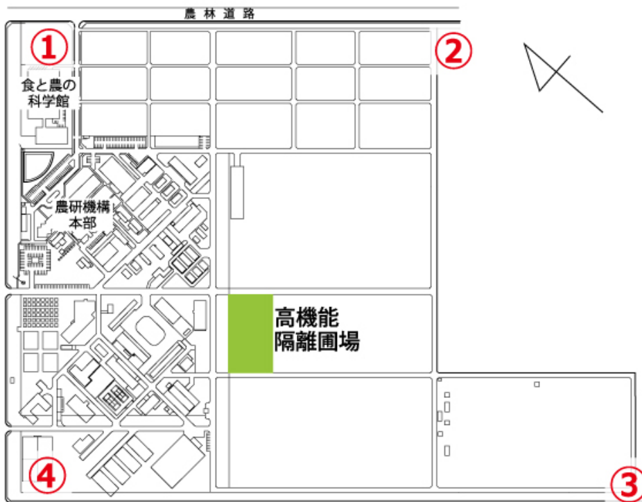
図 3 観音台第 1 事業場高機能隔離圃場（緑色）周辺のモニタリング用モチイネの配置図 ①から④の位置で、花粉飛散モニタリング用モチ品種「モチミノリ」等を栽培します。