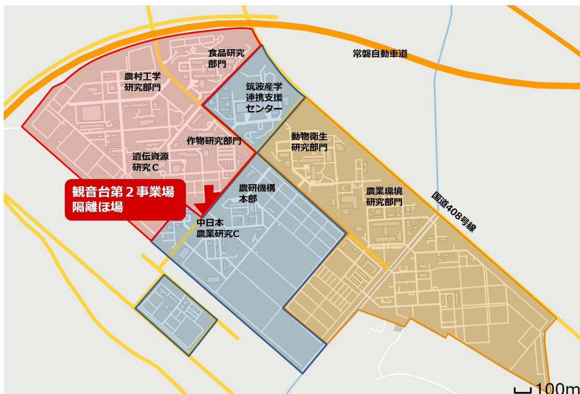
図 1 農研機構観音台地区周辺の地図と観音台第2事業場隔離ほ場の配置