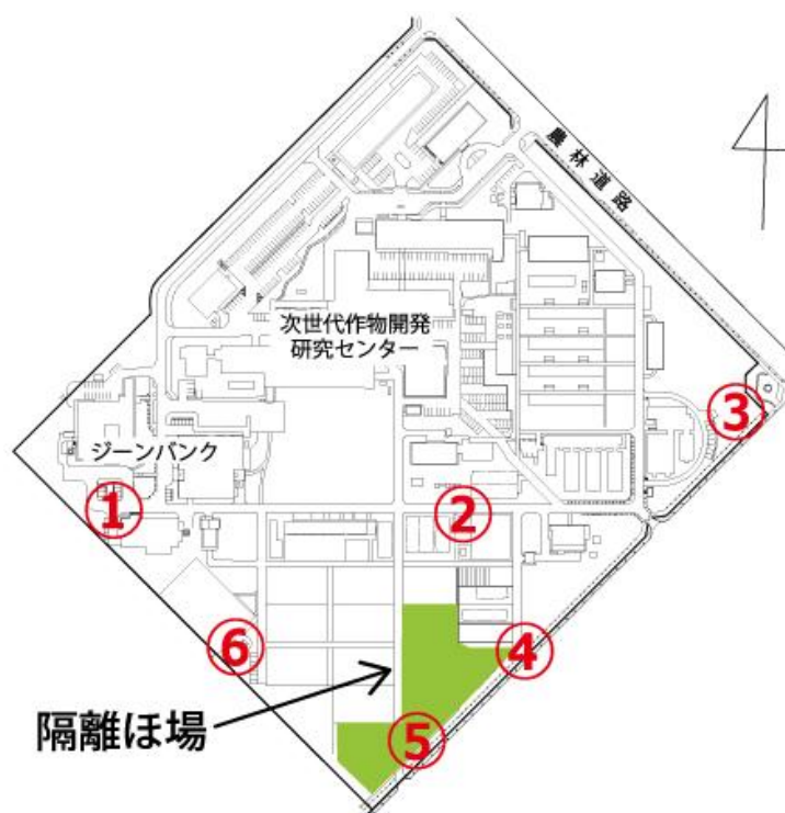
図 3 観音台第 2 事業場隔離ほ場（緑色）周辺のモニタリング用モチイネの設置場所 ①から⑥の位置で、花粉飛散モニタリング用モチ品種「はくちょうもち」を栽培します。