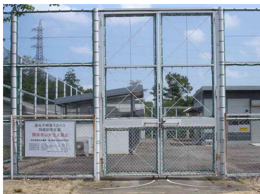
図5 隔離飼育区画入口