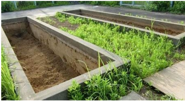
図9 残渣管理用の穴