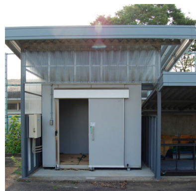
図6 貯桑室(クワを保管する冷蔵室)