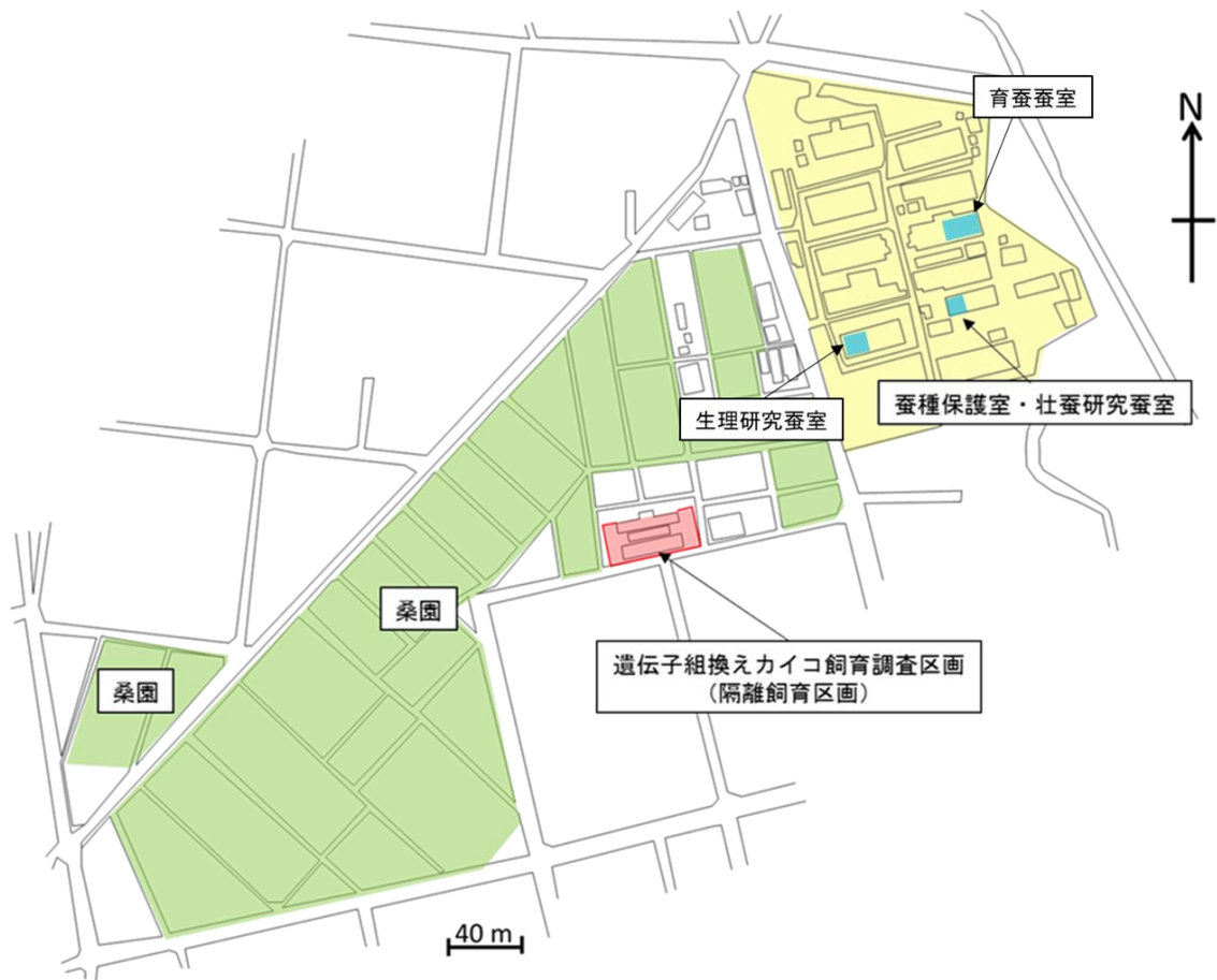
図3 群馬県蚕糸技術センター内配置図 赤く囲んだところが隔離飼育区画